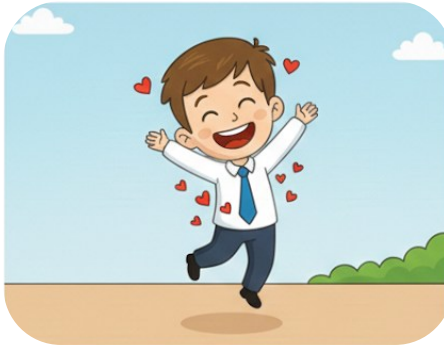
İçi içine sığmamak.

Kimseden izin almadan istediği gibi davranan.