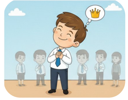
Burnu havada olmak.

Bir şeyi derinlemesine incelemeden, şöyle bir bakmak.