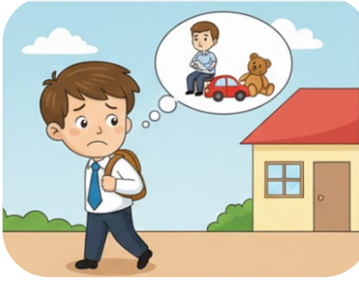
Gözü arkada kalmak:

Bir şeyi veya birini bırakırken huzursuz olmak.