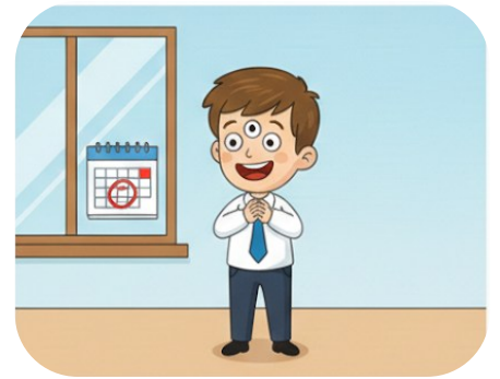
Dört gözle beklemek.

Büyük bir istekle ve sabırsızlıkla beklemek.