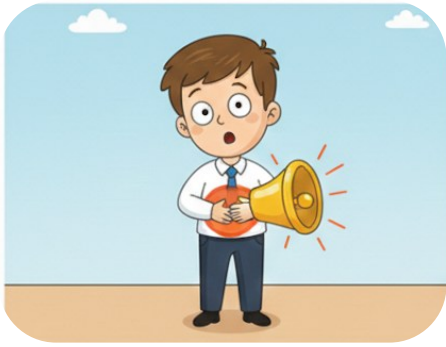
Karnı zil çalmak

Heyecandan veya korkudan konuşamaz hale gelmek.