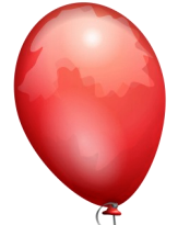
Balon: 19 TL

Esra yukarıda verilen balon ve gofreti alıyor. Satıcı Esra'ya 12 TL para üstü veriyor. Verilen para üstü hariç Esra'nın cebinde 22 TL'si kalmıştır.